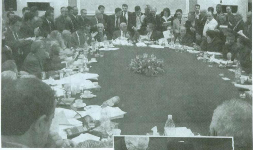
8 آذار/مارس 2004 في الساعة الرابعة بعد الظهر: الموافقة على الدستور المؤقت